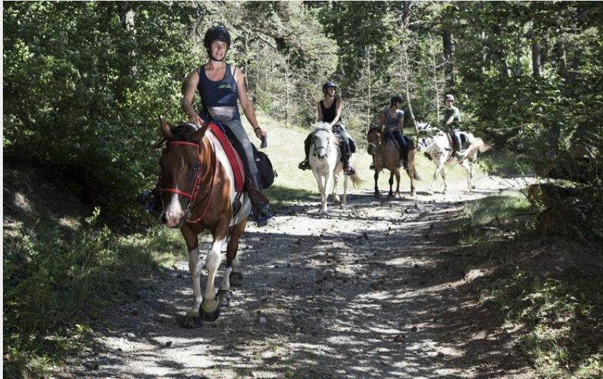
Randonneurs sur un sentier dans les bois