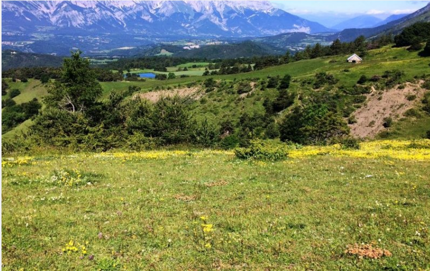
Lac de Barbeyroux en contrebas