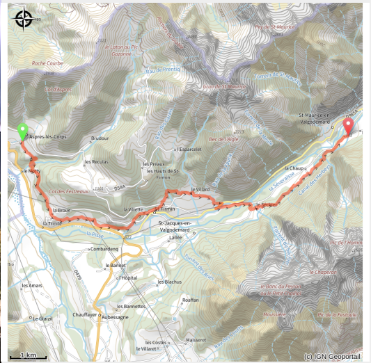
Fort de Saint-Firmin