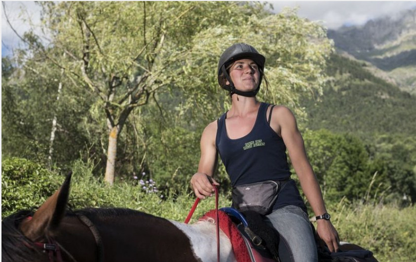
Randonneuse sur son cheval