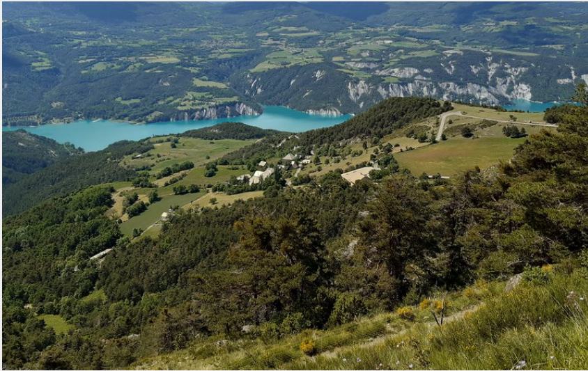
Vue sur la vallée de l'Ubaye