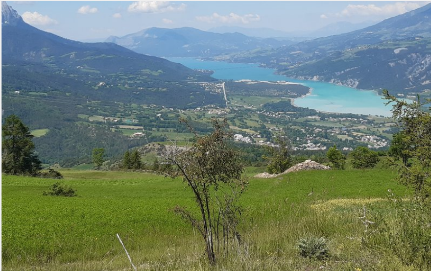
Le lac de Serre-Ponçon