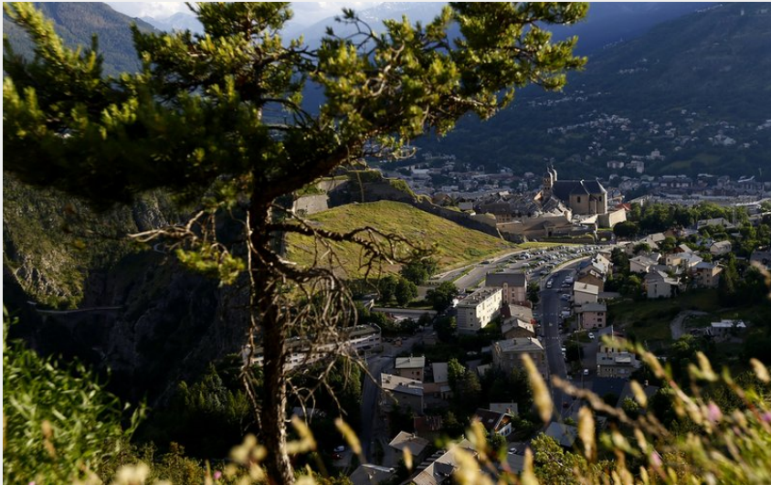
Point de vue sur la Cité Vauban