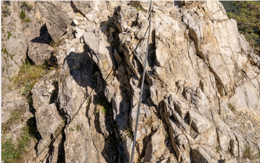
Vue de la croix de Toulouse (OTSCVB)