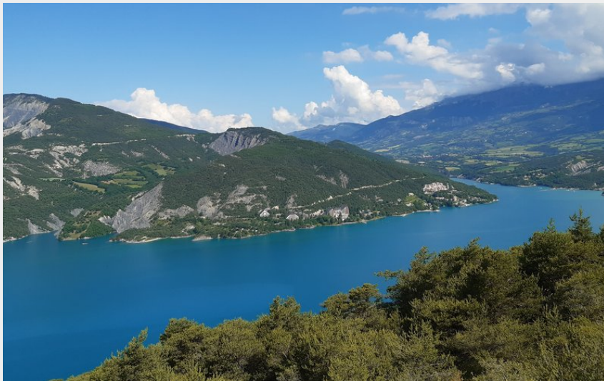
Le lac de Serre-Ponçon