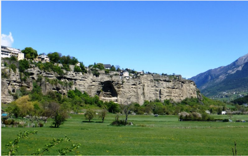
Le roc d'Embrun (florimont.tilliere)