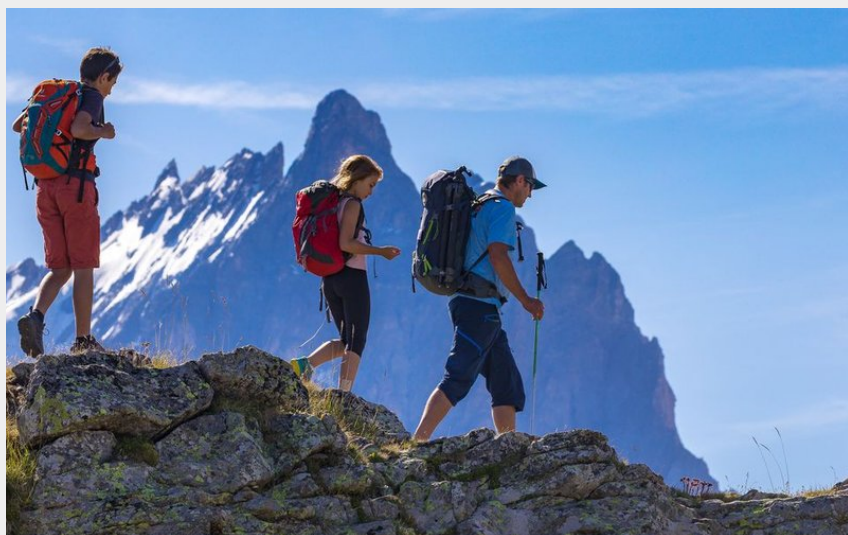
Plateau d'Emparis