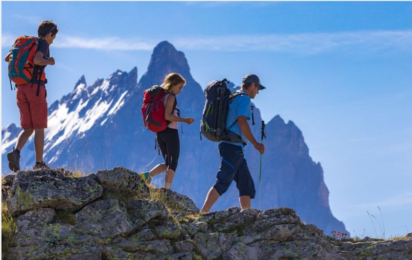
Plateau d'Emparis