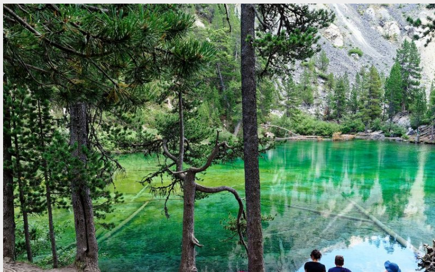
Le Lac Vert de la Vallée Étroite