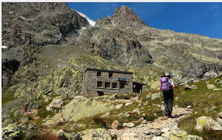
Arrivée au refuge du Pelvoux