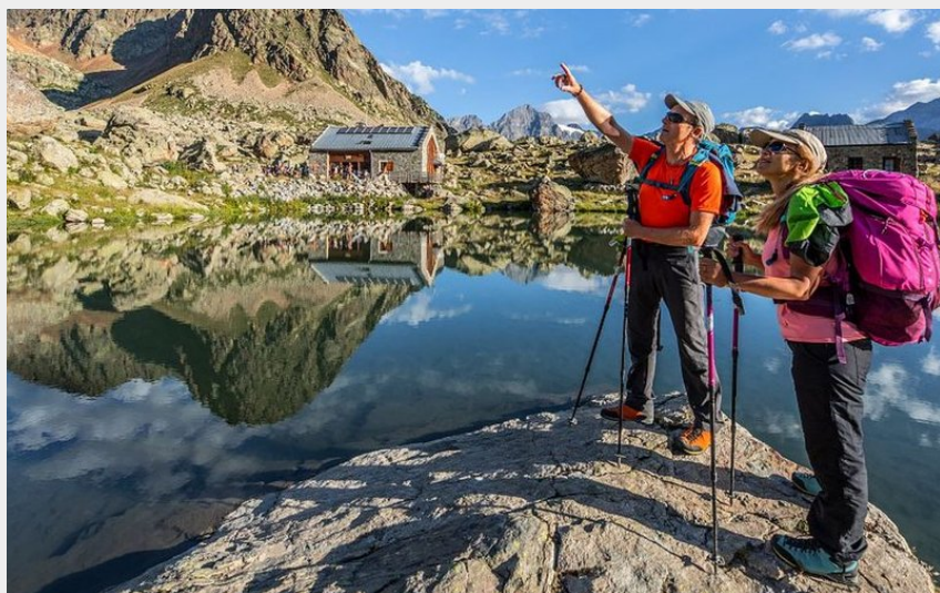
Refuge et lac de Vallonpierre