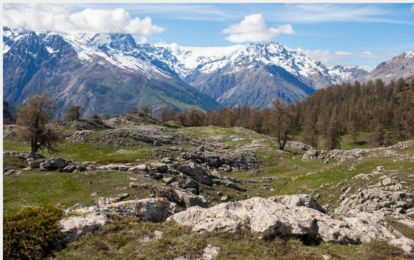
Panorama des Têtes (Thibaut Blais)