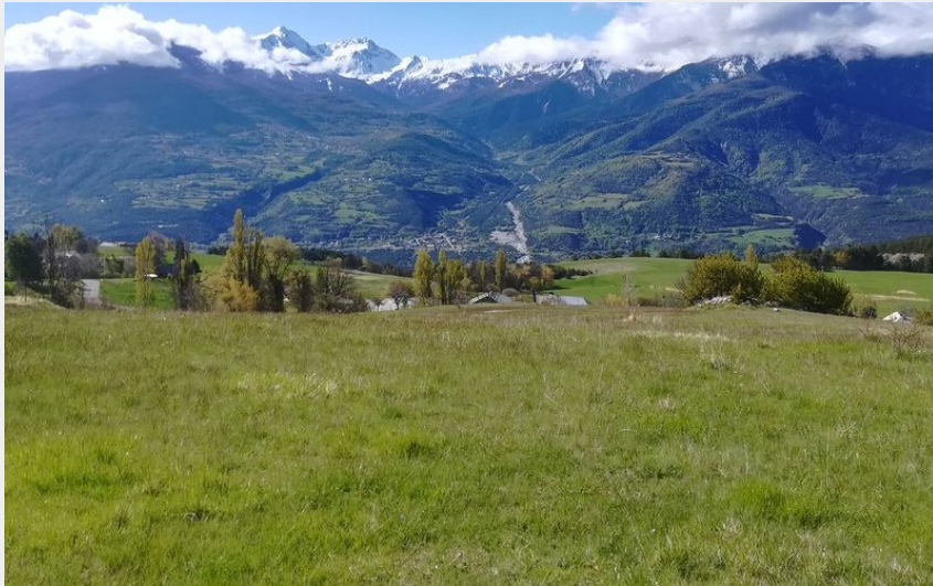
Paysage depuis Puy-Sanières (Amélie Vallier)