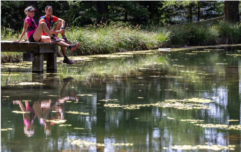
Au bord du lac