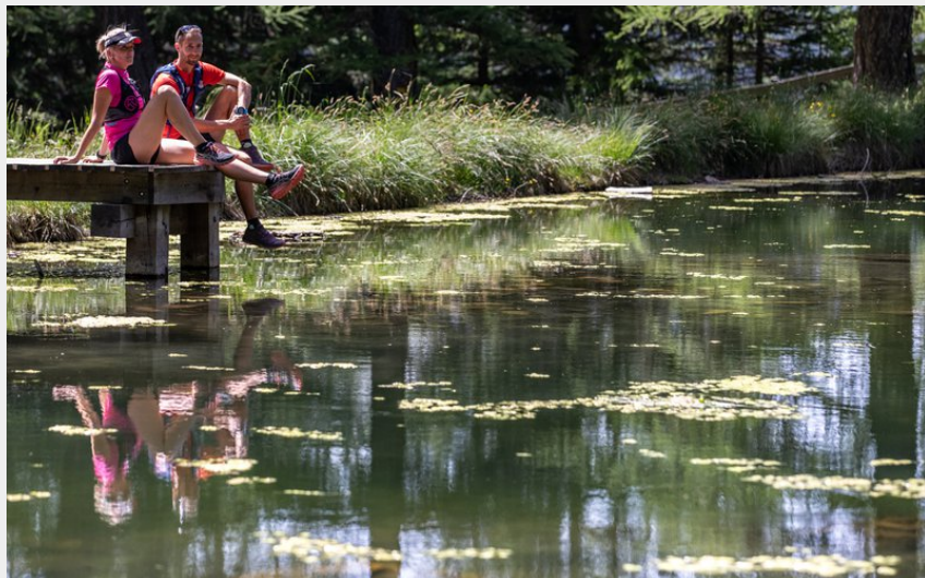
Au bord du lac