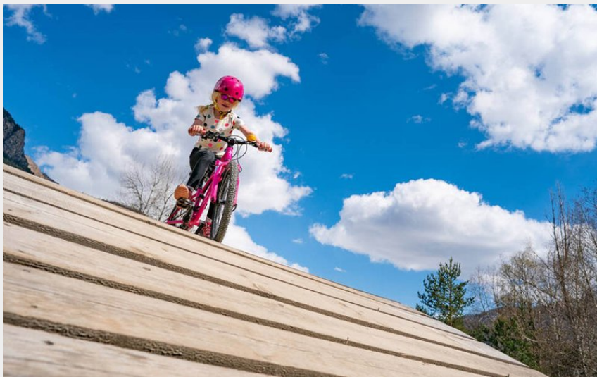
(Rogier Van Rijn)