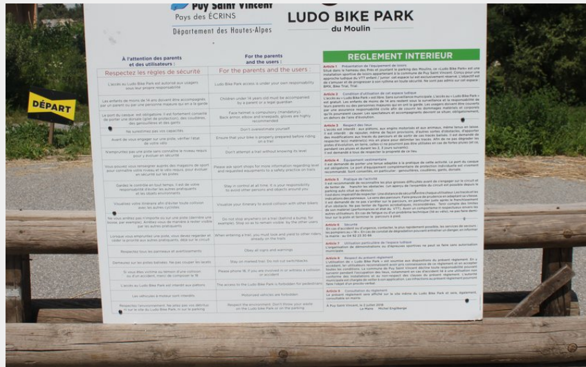
Ludo Bike-park (Office de tourisme du Pays des Écrins)