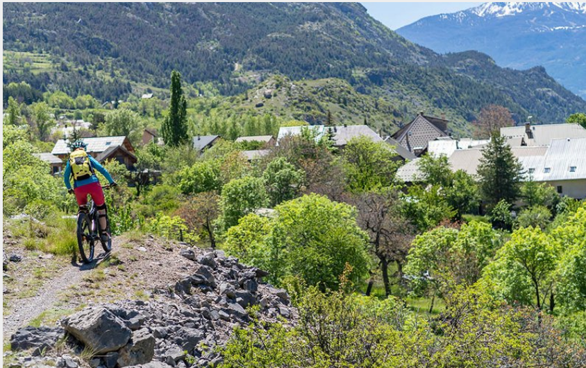
(Rogier Van Rijn)