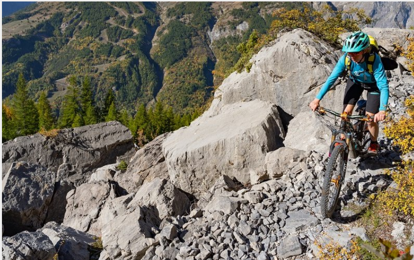
vue sur le Pelvoux