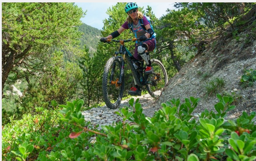
sentier en forêt d'adret