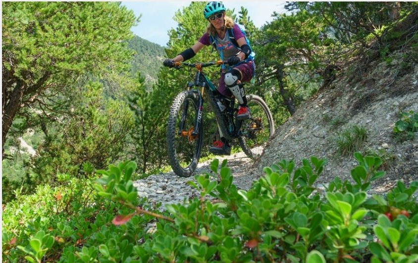
sentier en forêt d'adret