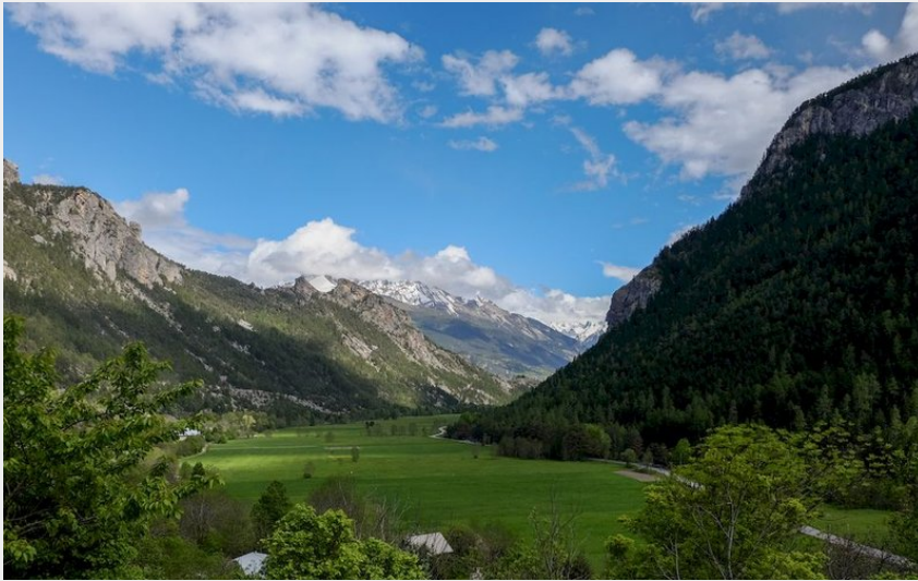
(Pays des Écrins - Pierre Nossereau)