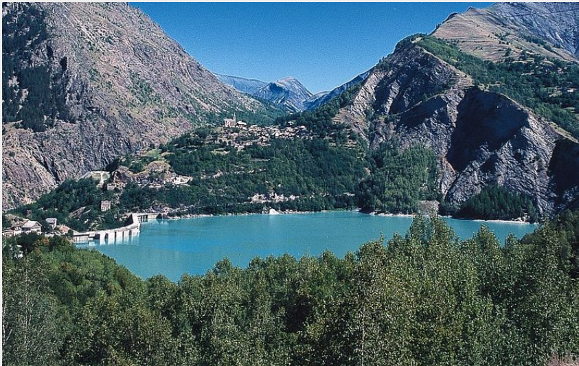
Lac Chambon (Pascal Saulay)