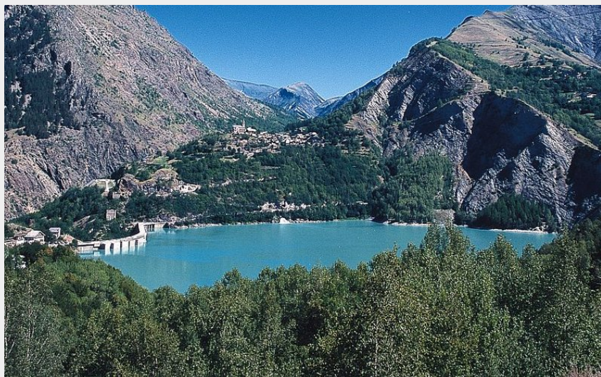
Lac Chambon (Pascal Saulay)