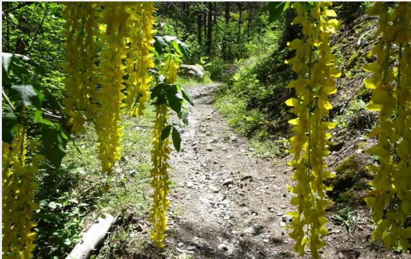
Le sentier du Cloutas (Office de tourisme Pays des Écrins)