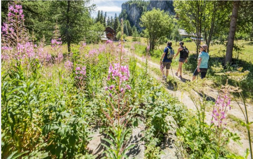
Col de la Pouterle