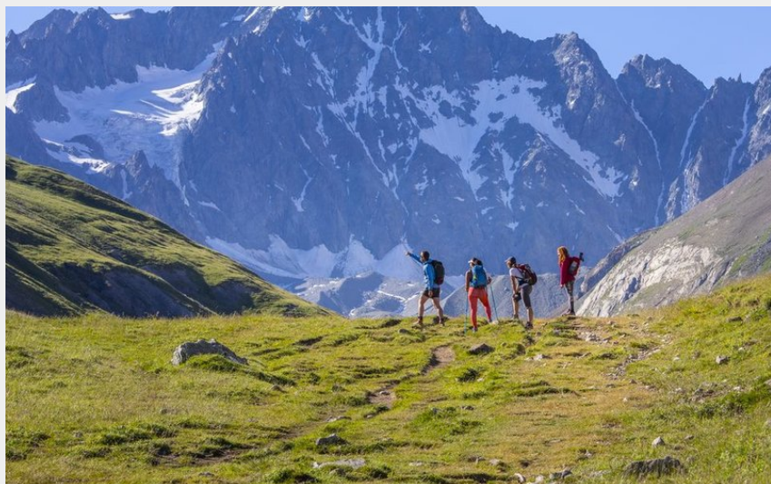
Vers le refuge de Villar d'Arène, les Agneaux au fond.