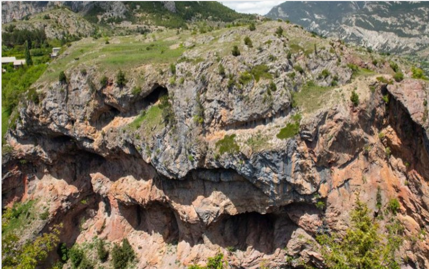
Le gouffre de Gourfouran (Thibaut Blais)