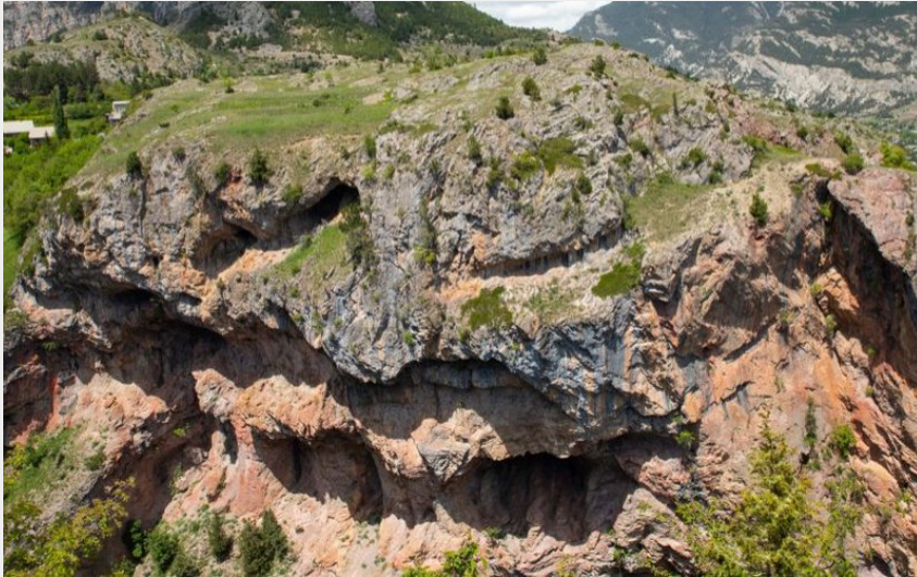
Le gouffre de Gourfouran (Thibaut Blais)