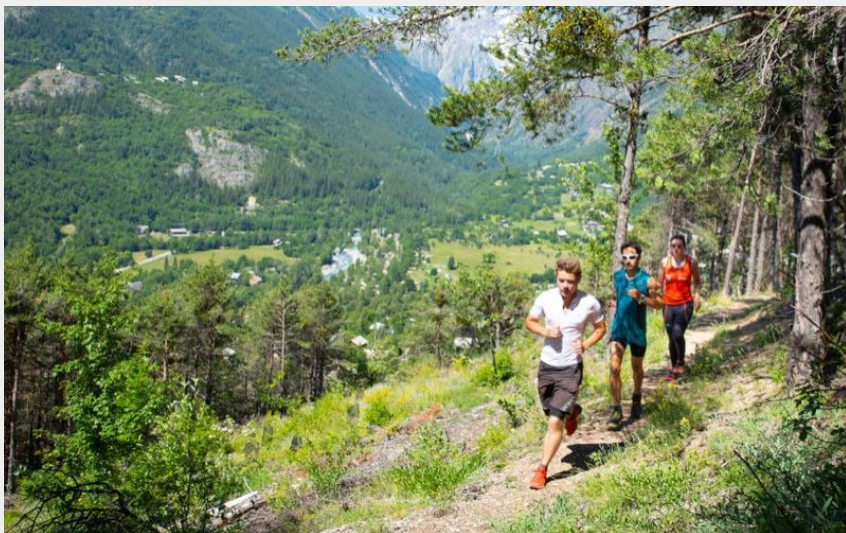
Traileurs - Parcours Trailounet (Thibaut Blais)