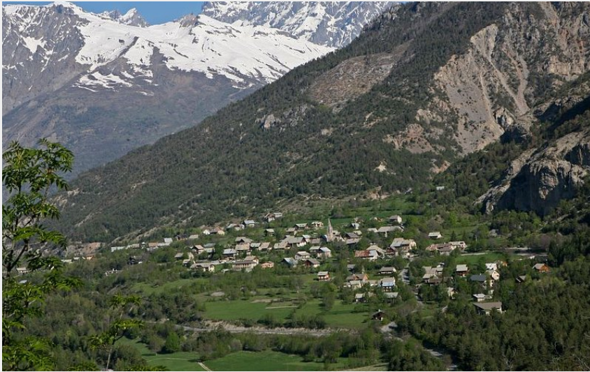
Village des Vigneaux et plaine de la Vallouise (Parc national des Écrins - Bernard Nicollet)