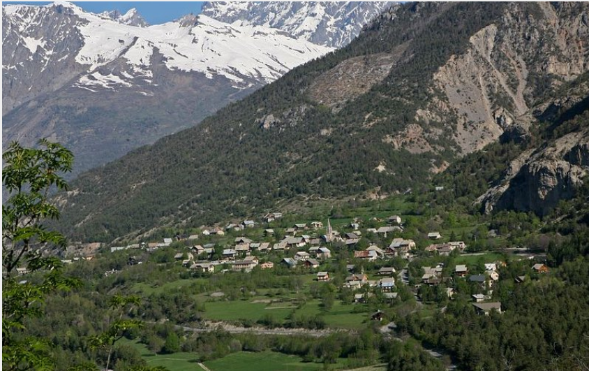
Village des Vigneaux et plaine de la Vallouise