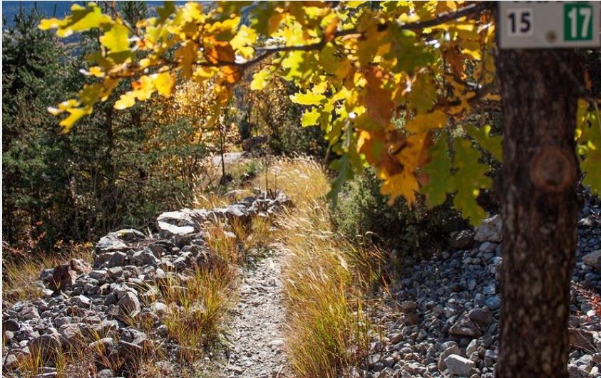
sentier le long du Gyr