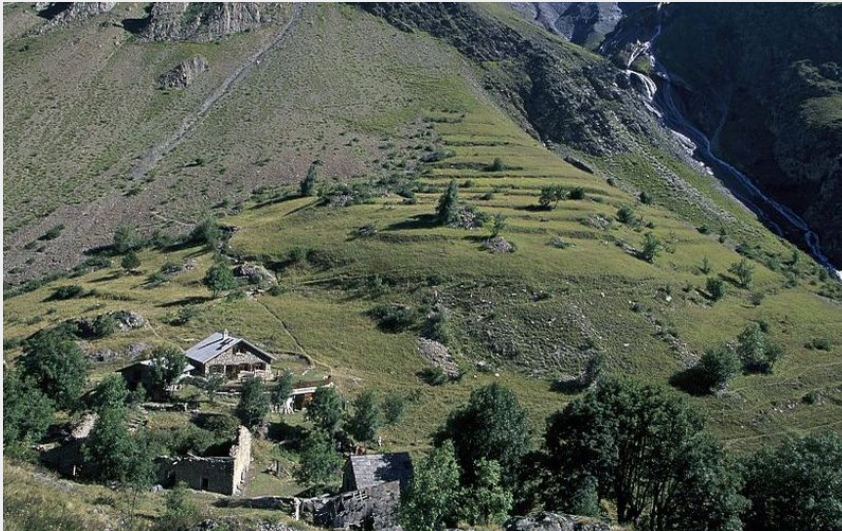
Refuge des Clots et l'ancien hameau (Cyril Coursier)