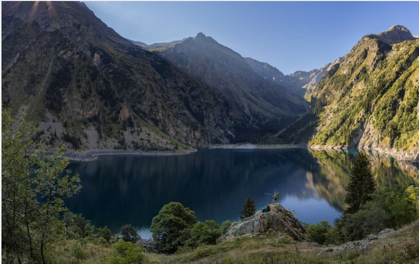
Coucher de soleil sur le lac du Lauvitel