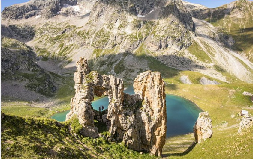
Roche Perchée et Lac de la Muzelle