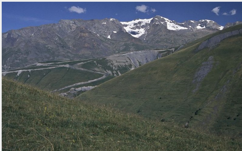
Les Grands Rousses