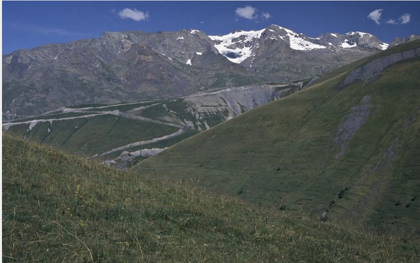
Les Grands Rousses