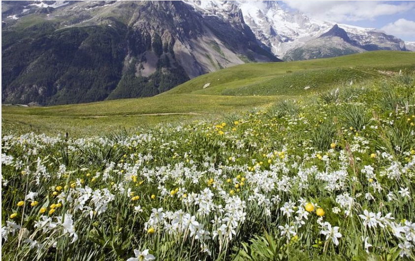
Pelouses alpines en aval du Col du Lautaret