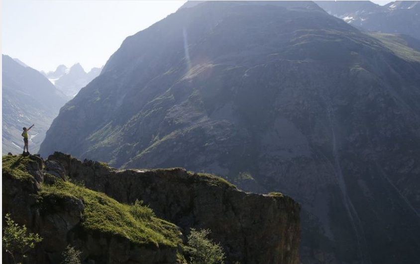
Le vallon de la Selle vu depuis la table d'orientation de Peyssa