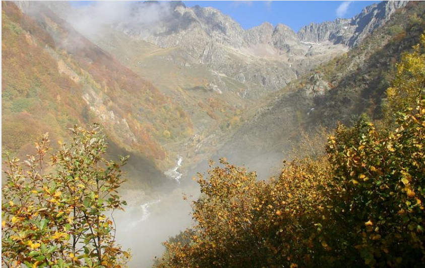
Vue sur le torrent du Villar et les Souffles