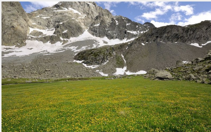
Tapie fleuri au pieds du Sirac, depuis Vallonpierre