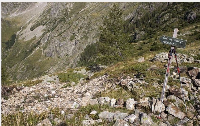
Du refuge des Souffles au col de la Vaurze