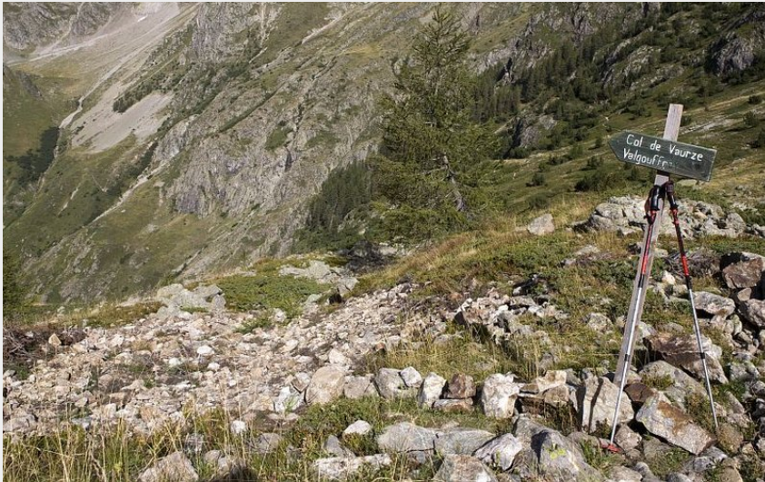
Du refuge des Souffles au col de la Vaurze