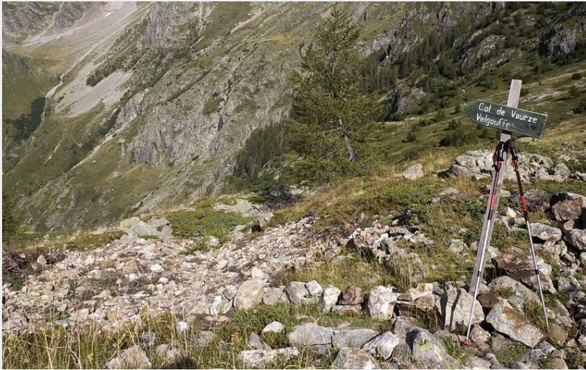
Du refuge des Souffles au col de la Vaurze