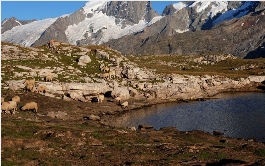
Troupeau d'ovins au plateau d'Emparis