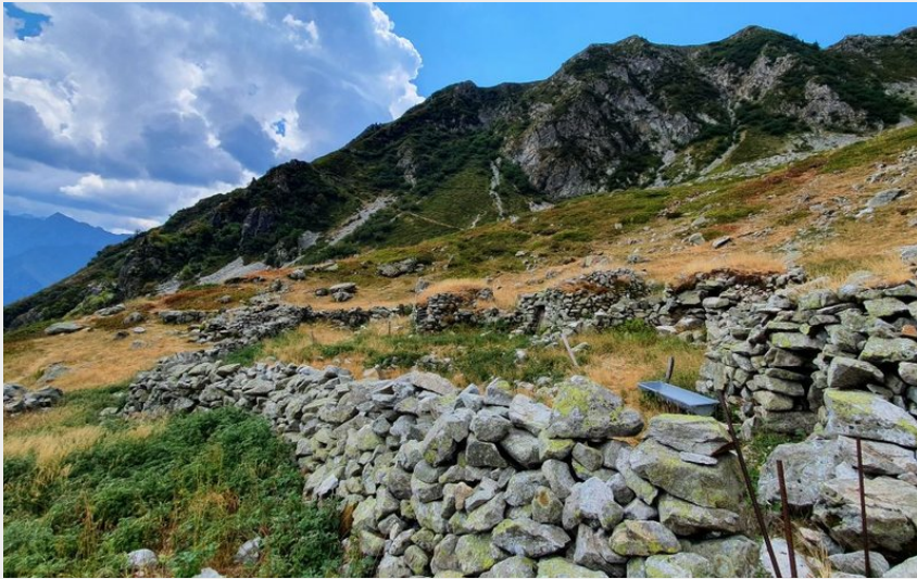
Site des 6 cabanes (Frédéric Sabatier - Parc national des Ecrins)